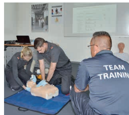
Formation de premiers secours

Pour l'académie, il est aussi essentiel que les formations proposées reflètent au mieux la réalité. La pratique occupe une place importante dans les différents modules, comme par exemple la « Lutte contre le feu » où les collaborateurs apprennent à maîtriser un incendie réel. D'autres formations plus sensibles sont dispensées, comme par exemple le module « Comportement en cas de braquage », au cours duquel les formateurs organisent une véritable mise en situation destinée à mettre les apprenants dans des conditions réelles. Le but étant d'identifier et corriger les éventuelles erreurs afin de ne pas les reproduire sur le terrain. Dans le domaine de la sécurité, il est en effet crucial d'avoir de bonnes connaissances pratiques pour maîtriser le travail quotidien.