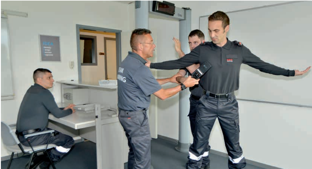
Formation de contrôle de personne

Afin de développer constamment une offre pertinente, l'académie a créé un référentiel ainsi qu'une matrice de compétences pour évaluer au mieux les besoins de chaque client. Le niveau de formation et d'expertise nécessaire pour les collaborateurs y est analysé, axé sur les 6 domaines constituant la branche de la sécurité évoqués ci-dessus. L'ensemble des missions confiées aux agents sont donc passées au travers de cet outil et évaluées. Suite à cette analyse, des modules de formation sont proposés en adéquation avec les missions demandées, afin que les agents acquièrent les compétences leur permettant de s'en acquitter de manière satisfaisante.