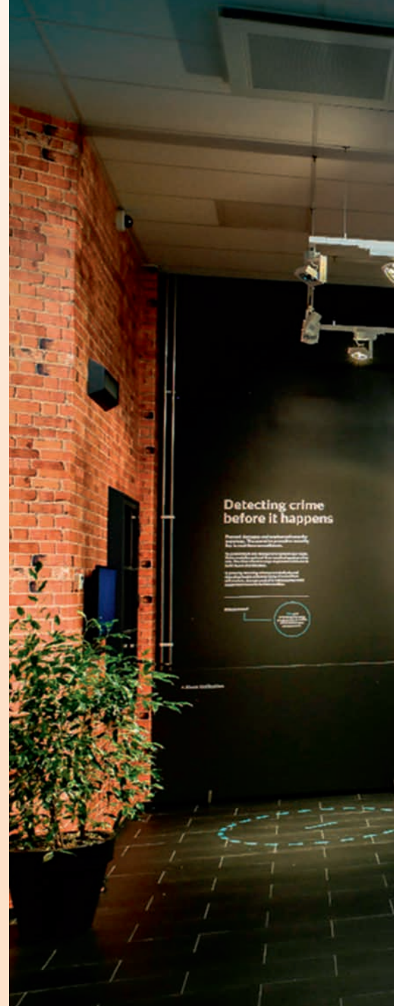
Bereich Schutz mit der Sicherheitslösung Remote Video Solution