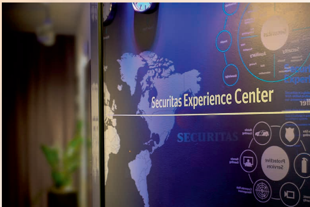
Eingang des Experience Centers

Remote-Dienste, die in unseren Überwachungszentren zum Einsatz kommen, erhöhen normalerweise die Sicherheit eines Standorts und sind gleichzeitig kostengünstig für den Kunden. Besucher können diskutieren und verstehen, wann diese Dienste zusätzlich zu bzw. in Kombination mit herkömmlicher Bewachung entweder vor Ort oder mobil zur Anwendung kommen.